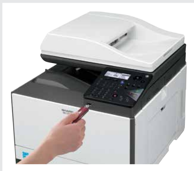
PORT USB DOSTĘPNY OD PRZODU

Oba modele zostały wyposażone w praktyczny port USB, umożliwiający bezpośrednie drukowanie i skanowanie z pamięci USB. Jeśli wybierzesz model MX-C300W, możesz podłączyć go do bezprzewodowej sieci i bezprzewodowo drukować ze swojego smartfona lub tabletu.