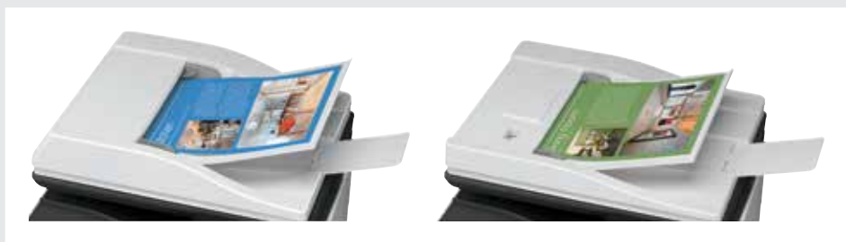
WYBÓR PODAJNIKÓW PAPIERU