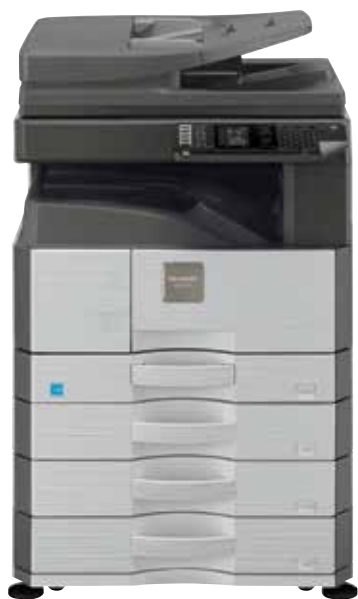
Pokazano model AR-6023N

AR-6023D/N AR-6020D/N AR-6020 Monochromatyczne urządzenie wielofunkcyjne